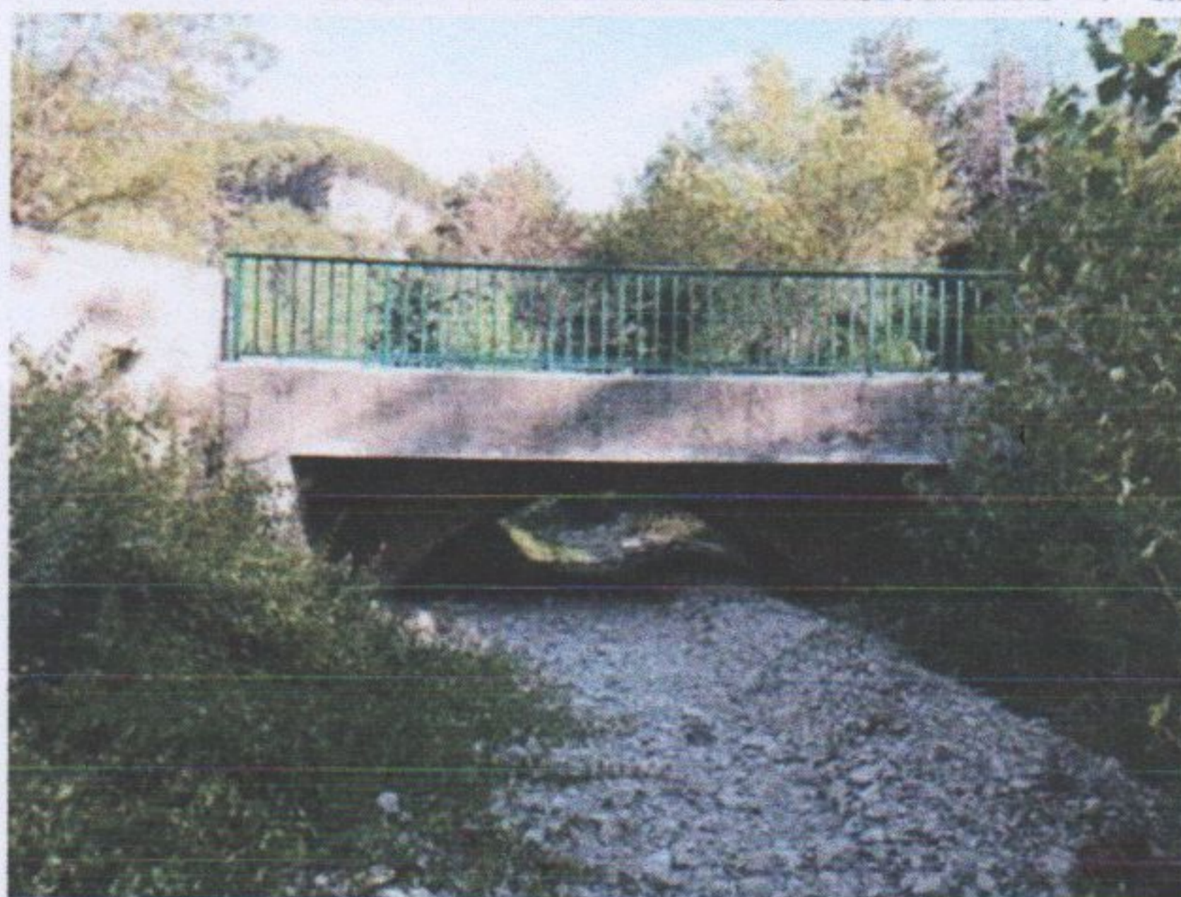
Pont bouché à 80 %